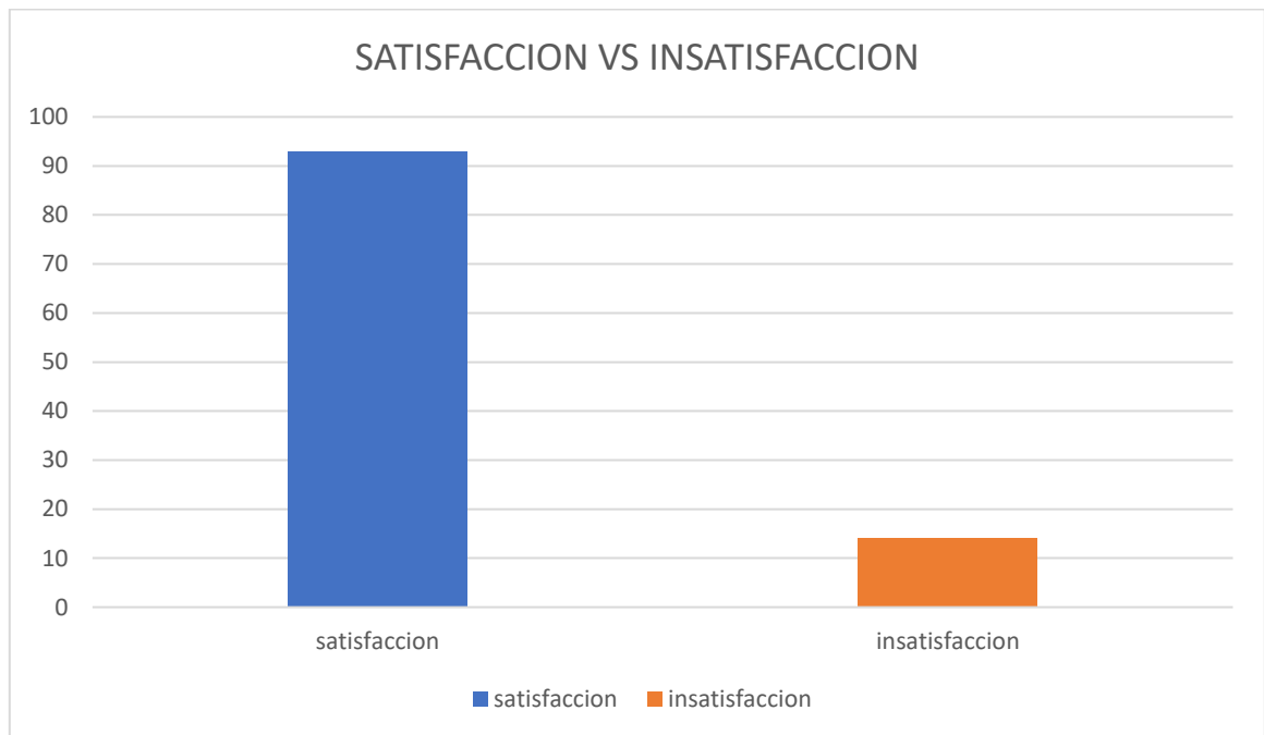
Grafica 1. Satisfacción vs insatisfacción con la respuesta dada al usuario.

A continuación, se muestra la gráfica de comparación entre la satisfacción e insatisfacción con la respuesta dada al usuario.