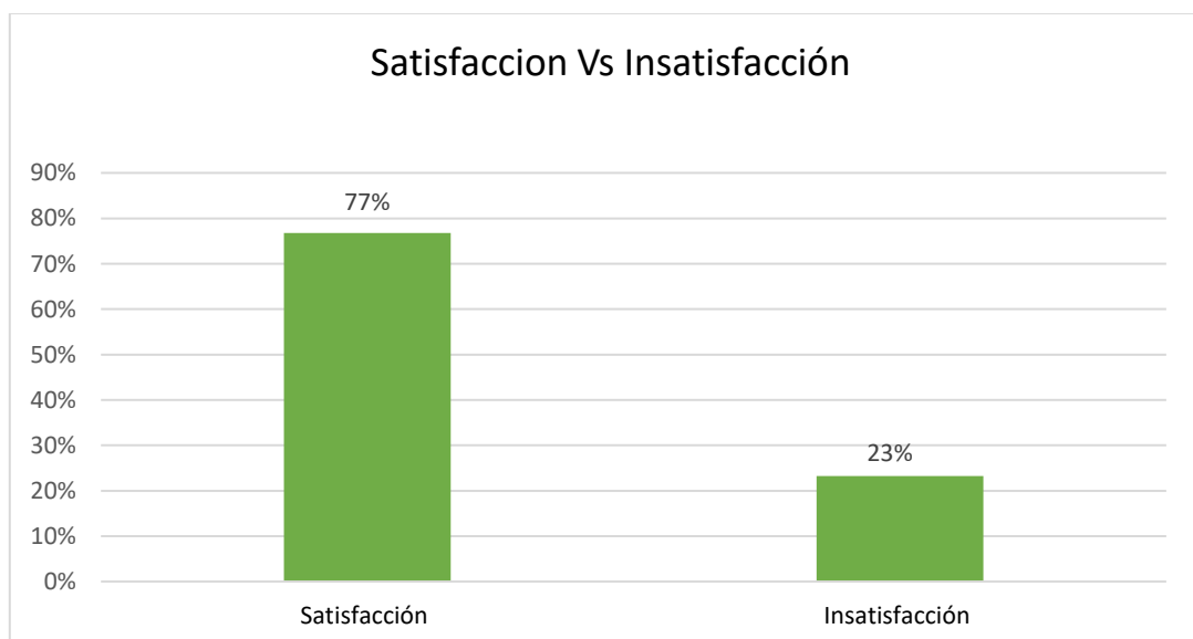
Grafica 1. Satisfacción vs insatisfacción con la respuesta dada al usuario.

A continuación se muestra la gráfica de comparación entre la satisfacción e insatisfacción con la respuesta dada al usuario.