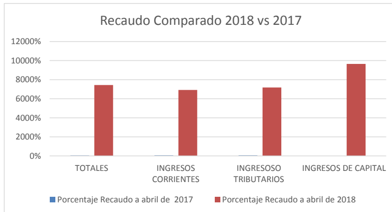
Cuadro Comparativo enero a diciembre de 2017 Vs. Mismo periodo 2016

Observación: Se evidencia un recaudo inferior en 2018 con respecto a 2017. Se observa un recordó de -9% en 2018 con respecto a 2017; siendo -13% por ingresos corrientes y -11% por ingresos tributarios y -1% en ingresos de capital. La Oficina de control Interno recomienda hacer un análisis de causas de este comportamiento y establecer estrategias de mejora.