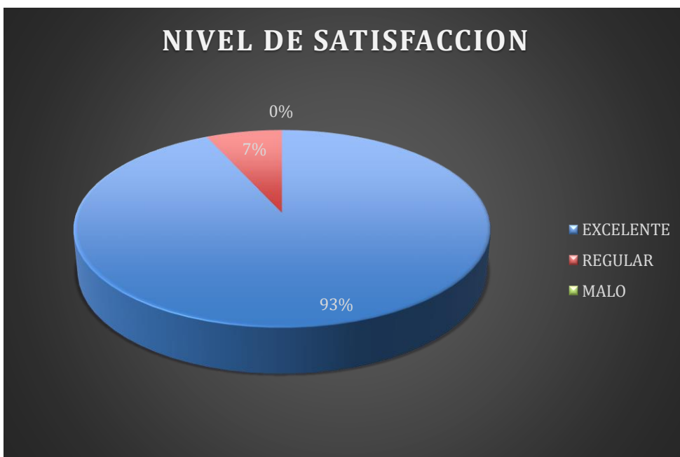
Gráfica, Calificación del servicio a través del chat (58 usuarios calificaron el servicio)